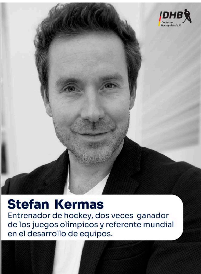
Stefan Kermas Entrenador de hockey, dos veces ganador de los juegos olímpicos y referente mundial en el desarrollo de equipos.