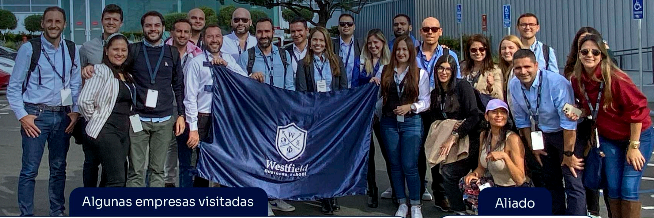
Algunas empresas visitadas

A lo largo de esta semana, los asistentes conocerán las herramientas necesarias para adaptarse a las nuevas realidades del mercado y aprenderán cómo aumentar la probabilidad de que un negocio funcione.