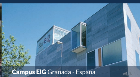
Campus EIG Granada - España